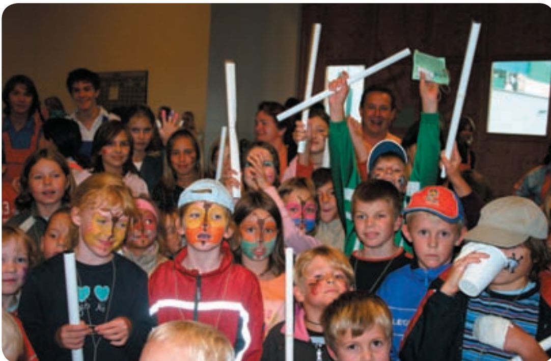
Großes Kinderferienabschlussfest mit der Musik Tagwerker und vielen freiwilligen Helfern bei den Spielen. Nochmals Danke!