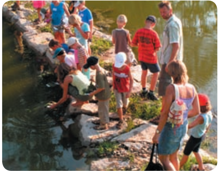
Im Reich des Froschkönigs

Kinderhort Pinselstrich, UNION und ASKÖ, Naturfreunde, GRÜNE Katsdorf, EIKiz „Ich und Du“, ÖVP Frauen, Volkshochschule, Heimatverein, Kino, Easy Kisi, ÖAAB, SPÖ, Ortsbauernschaft, ÖVP, FF Katsdorf, Kinderfreunde, Familienbund, Jungschar, Musikverein, Obstbauverein und Elternverein.